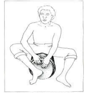
Figure 2 : Manière de jouer le "Tombou Béle".